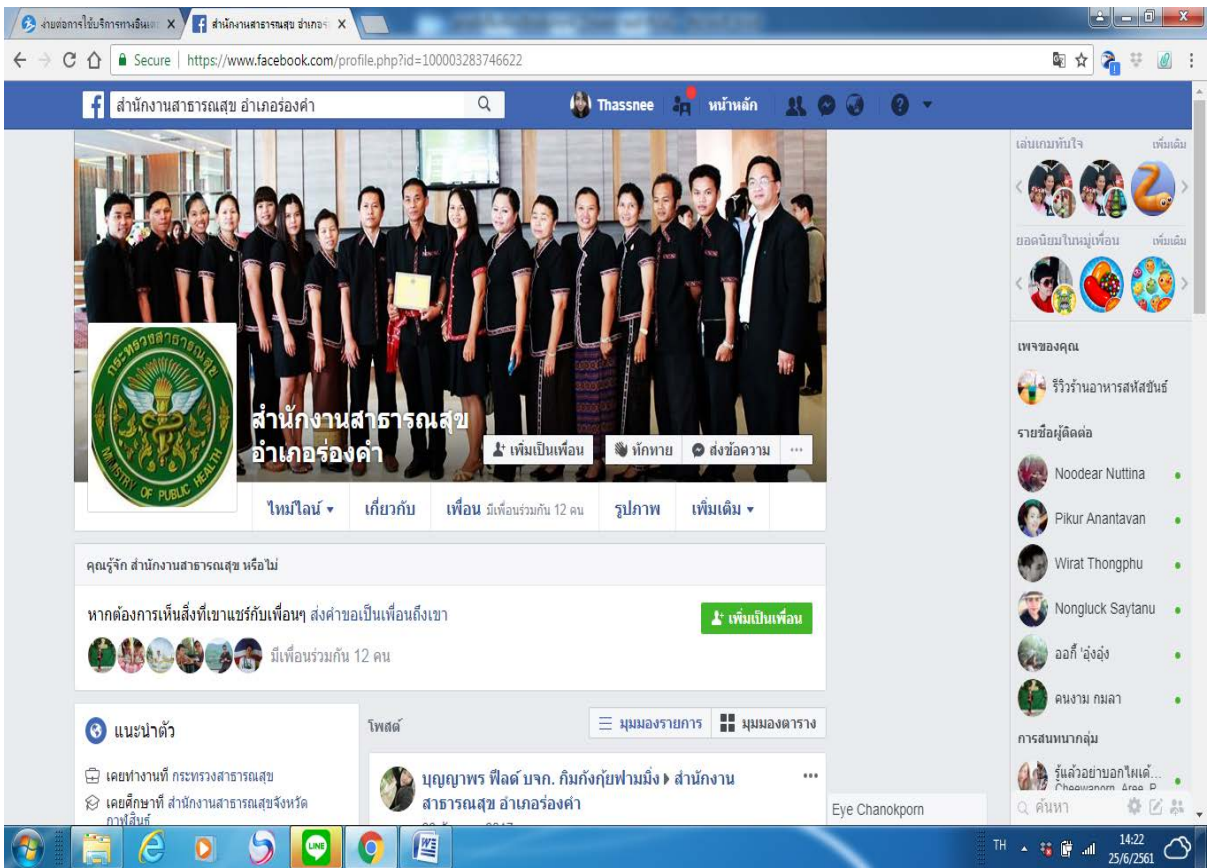
3.ภาพแสดงช่องทางรับเรื่องร้องเรียน/ร้องทุกข์