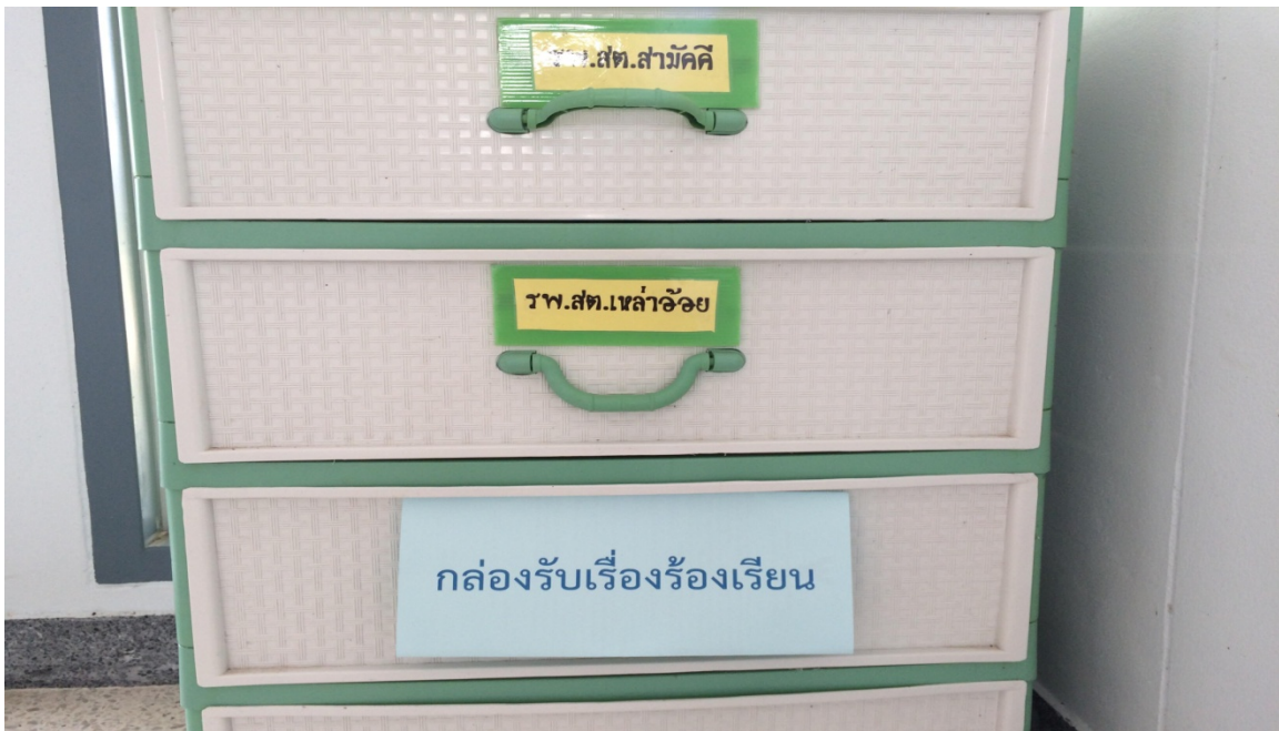
2.ภาพแสดงช่องทางรับเรื่องร้องเรียน/ร้องทุกข์