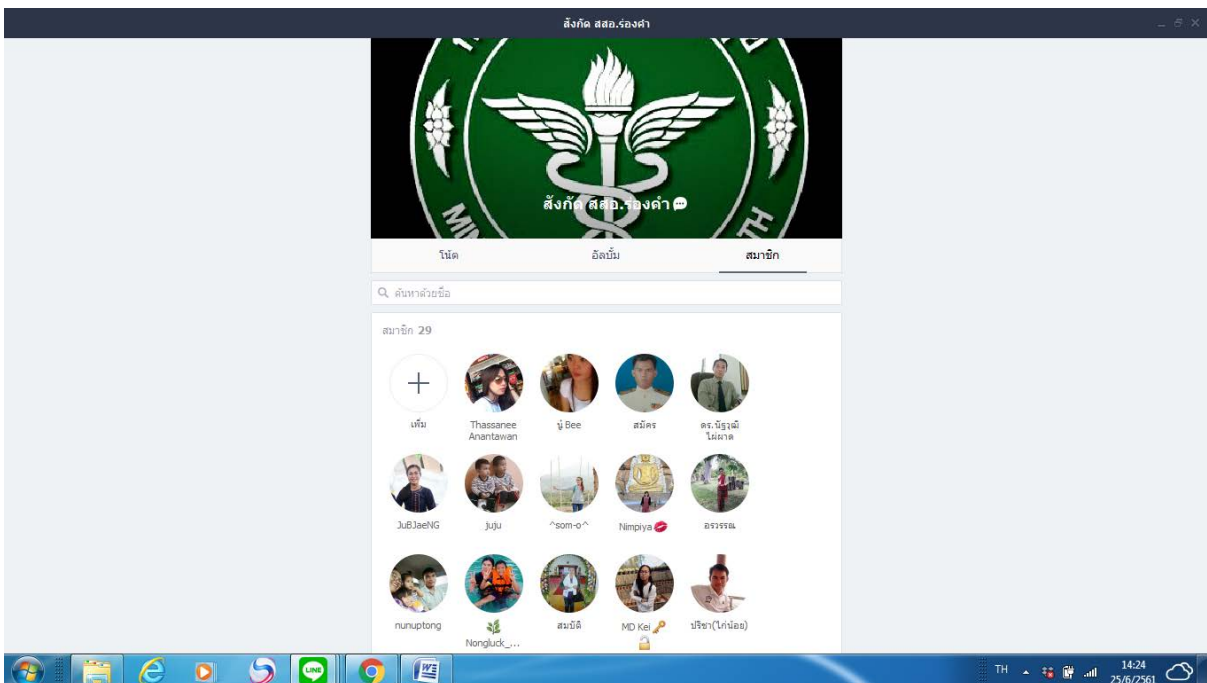
4.ภาพแสดงช่องทางรับเรื่องร้องเรียน/ร้องทุกข์