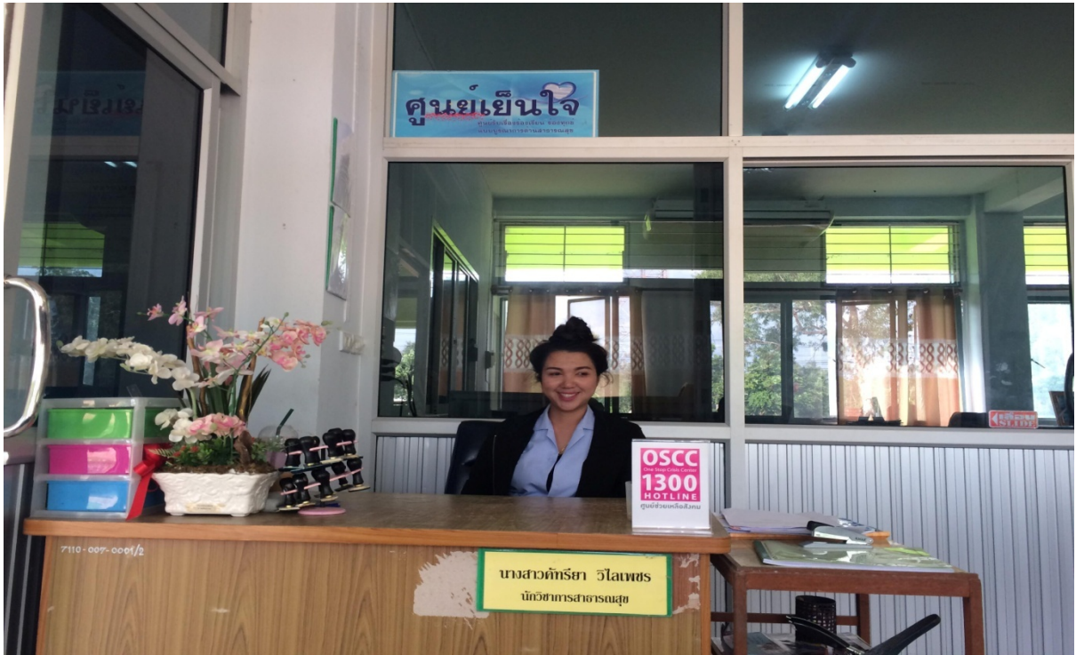
1.ภาพแสดงศูนย์รับเรื่องร้องเรียน/ร้องทุกข์